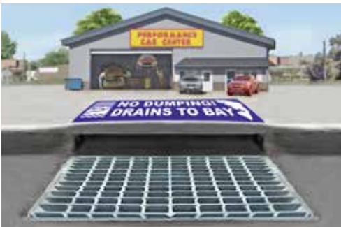
Cống Thoát Nước Mưa: Cống ngoài trời chảy trực tiếp vào các nhánh sông và Vịnh.

Nếu cửa hiệu của quý vị có ống thoát theo tầng, vui lòng liên hệ cơ quan xử lý nước thải địa phương để biết yêu cầu về việc xả vào cống nước thải.