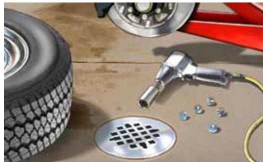
Cống Nước Thải Sinh Hoạt: Cống trong nhà chảy đến nhà máy xử lý chất thải.